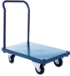
Capacité 1200 lbs - roues 5" résilex

DESSUS D'ACIER Les roues de résilex sur ces plates-formes ne laissent pas de marques sur les planchers et offrent une capacité totale de 1200 lb.