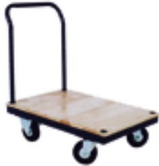
Roues 5" résilex

Les roues de résilex sur ces plates-formes ne laissent pas de marques sur les planchers et offrent une capacité totale de 1200 lb.